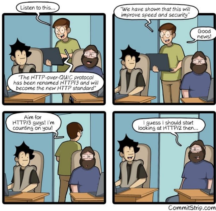
Figure 1: HTTP/3